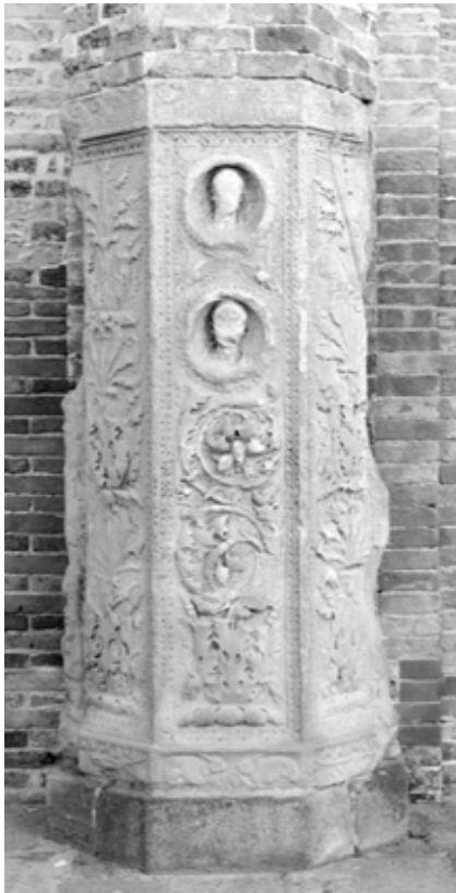
Parte del monumento sepolcrale degli Acilii (I sec. d.C.), proveniente da Altino, reimpiegato nella facciata della basilica di S.Maria e Donato a Murano.

Ancora oggi si possono incontrare a Venezia o nelle sue isole alcuni esempi di lapidi o monumenti, di epoca romana, con tutta probabilità provenienti da Altino, usati come fondazioni o come strutture architettoniche.