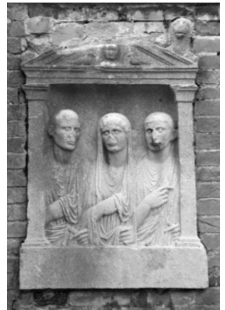
Edicola funeraria romana (I sec. d.C.), nel muro di cinta del giardino di Ca' Mangilli-Valmarana sul rio di Ss. Apostoli in Strada Nova.