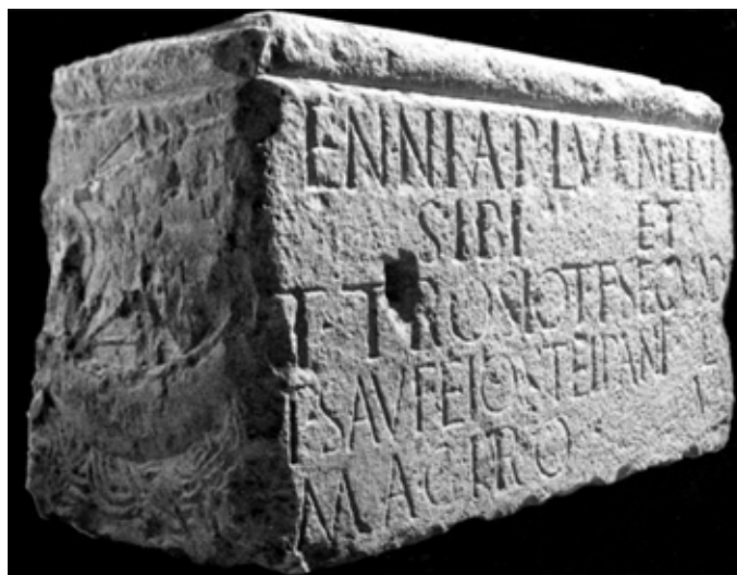
Urna sepolcrale di Ennia Veneria, già riutilizzata nel campanile di S. Pietro di Castello, oggi al Seminario Patriarcale di Venezia (foto tratta da CALVELLI L., Da Altino a Venezia , cit.).