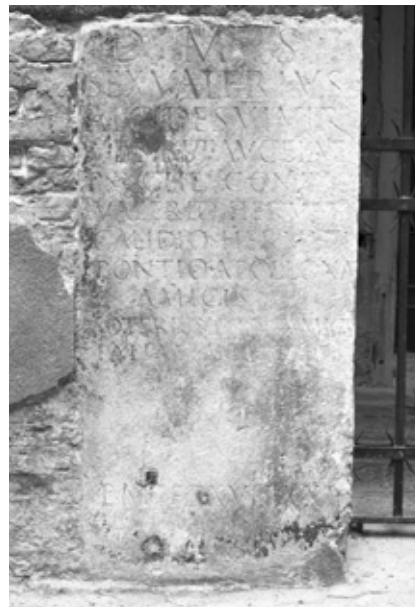
Lapide sepolcrale reimpiegata in calle dei Pali già Testori a S. Felice.

All'inizio del 1800 però l'interesse antiquario portò non solo allo studio, ma, per scopi di conservazione,