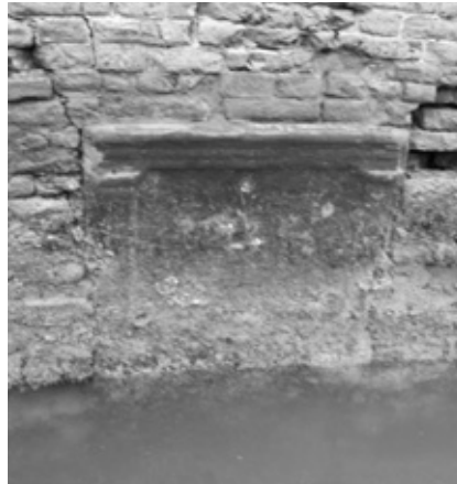
Epigrafe sepolcrale dei Mestrii, nelle fondazioni di Ca' Soranzo dell'Angelo, a S. Marco in rio della Canonica.

Un'iscrizione funeraria romana, purtroppo in cattive condizioni di conservazione, si può ancora vedere, soltanto con bassa marea e