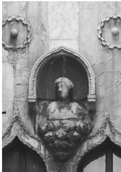
Busto romano (II-III sec. d.C.) sopra la bifora trecentesca di Cà Zorzi-Bon in calle dell'Arco detta Bon in Ruga Giuffa.