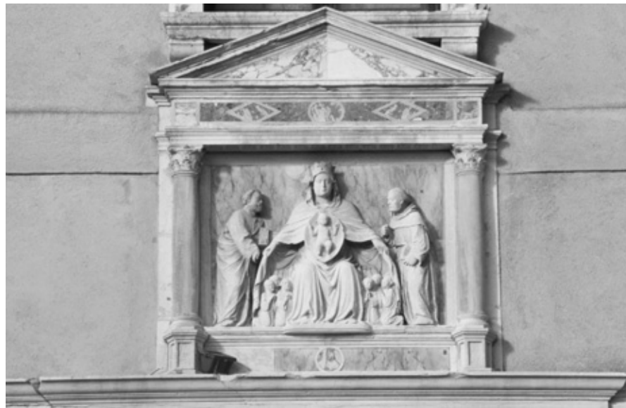
Madonna della Misericordia (Scuola dei Mercanti, Cannaregio, Madonna dell'Orto) restaurata grazie al contributo dei soci dell'Archeoclub di Venezia.

Ma tali opere sono alcune migliaia. Sculture, patere , lapidi, fregi, capitelli, etc., e naturalmente pozzi, cippi, fontane, pili, portali, etc., di proprietà pubblica e privata, oltre a creare il fascino di una città unica qual è Venezia, ne rappresentano anche la memoria storica: sono infatti testimonianze della vita e delle attività che si sono svolte in città nei secoli, quali i simboli delle scuole d'arte e mestiere, gli stemmi delle casate nobili, le lapidi che ricordano avvenimenti storici.