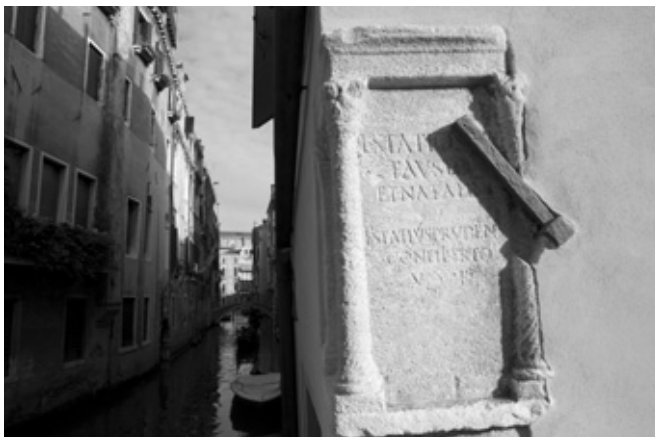
Iscrizione funeraria romana riutilizzata a Venezia presso ponte dei Preti a S.M. Formosa.

Nei primi secoli furono usati i materiali immediatamente e più facilmente disponibili. Dopo la caduta dell'Impero d'Occidente, i fuggiaschi di fronte all'avanzata dei barbari, abitanti dei primi insediamenti lagunari, quali Torcello, Mazzorbo e Rivo Alto, portarono con sé molti manufatti, provenienti soprattutto dalle città romane più vicine, abbandonate, come Altino e Aquileia. Da Altino, primigenia Venezia, posta ai margini della Laguna, importante nodo viario della X Regio Venetia et Histria , raggiungibile tramite canali fluviali ed endolagunari, furono prelevati lapidi, cippi, altari, edicole funerarie, che poi furono riutilizzati per scopi edilizi.