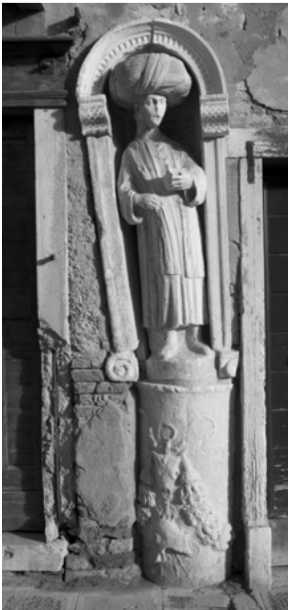
Uno dei quattro Mori a Cannaregio è posto sopra un altare funerario romano di tipo altinate.

Alcune statue e opere classiche visibili su pareti e facciate di palazzi veneziani sono frutto di questo collezionismo d'arte, che in certi casi era manifestazione di una volontà di distinzione da parte della famiglia patrizia quale richiamo a nobili origini, dall'ideologia dominante osteggiata moralisticamente come manifestazione di superbia e di decadenza.