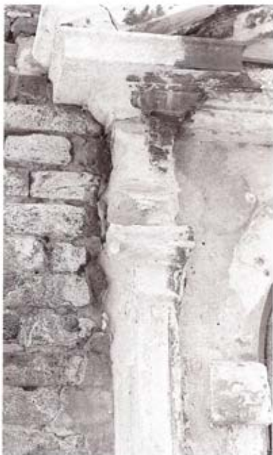
28 - Particolare del Tabernacolo di S. Antonio (I metà del 1500) ai Gesuiti. Alcune parti sono ormai completamente corrose.