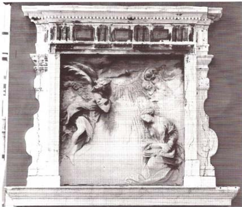
40 - "Annunciazione" attribuita a Giusto Le Court. Alberto Rizzi, nel suo volume La scultura esterna a Venezia (Stamperia di Venezia Editrice, 1987, p. 329), la definisce "una delle più belle sculture all'aperto del Seicento veneziano".

Questo numero è stato pubblicato con il contributo della