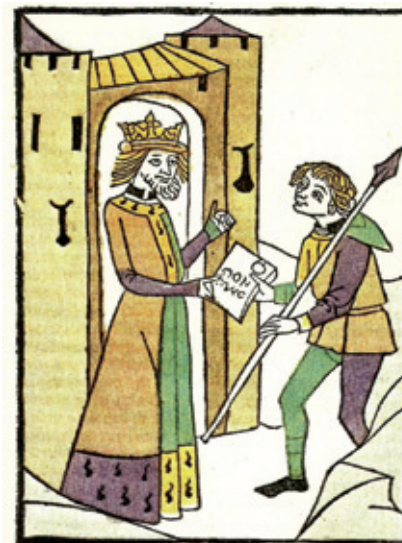
Un corriere consegna un messaggio al re (Ginevra, miniatura medievale)