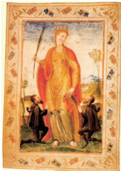
S. Caterina, protettrice della Compagnia , con inginocchiati due Corrieri con il tradizionale corno postale ( Mariogola della Compagnia dei Corrieri Veneti , Venezia Museo Correr)

Nella toponomastica veneziana rimane il ricordo delle Poste "straniere": nei pressi di SS. Apostoli ci sono sia Calle della Posta di Fiandra , dove erano le case dei baroni de Taxis (famiglia che aveva in appalto molte linee postali), sia Calle della Posta di Fiorenza .