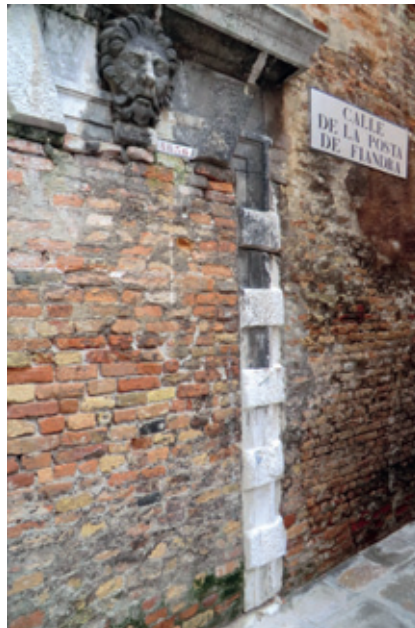
Calle della Posta di Fiandra (Venezia, SS. Apostoli)

Fino agli inizi del 1700 per la disinfezione della corrispondenza si usarono soprattutto sostanze aromatiche, quali