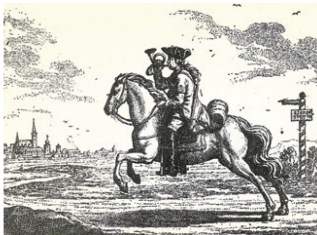
Il corriere postale sta per arrivare a destinazione e col suono del corno avverte il mastro di posta perché prepari il cavallo per il cambio (Incisione settecentesca)

Col costante aumento dell'attività, i corrieri, che fino ad allora avevano agito in modo indipendente, decisero di unire i propri interessi costituendosi il 10 maggio 1489 nella Compagnia dei Corrieri Veneti , rimasta attiva fin oltre la caduta della Repubblica e chiusa definitivamente da Napoleone nel 1806. La Compagnia si