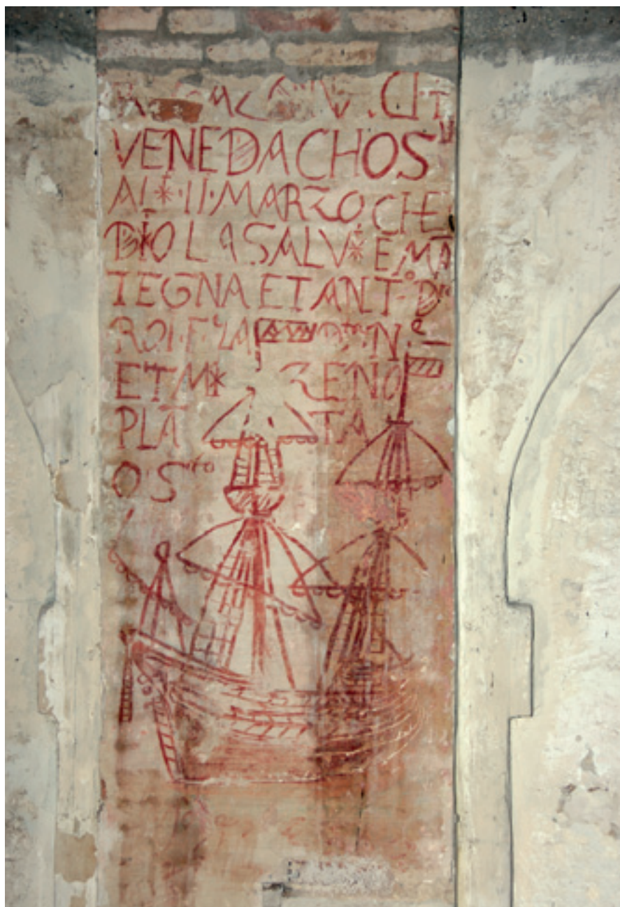
Nave (galeone) "... CHE VENE DA CHOS(...)LI AD 11 MARZO CHE DIO LA SALVI E MANTEGNA ET ANTONIO DETTO ROI F(EC)E LA NAVE E MI ZENO PLA()TA O' S(CRIT)TO (Iscrizione e disegno di fine sec. XVI nel Tezon Grande)

lungo le pareti del Tezon Grande. Databili tra la fine del 1500 e i primi decenni del 1600, queste testimonianze, protette da un provvidenziale strato di calce, dopo secoli stanno tornando alla luce a seguito di un lungo e paziente lavoro di restauro, grazie anche al contributo del Comitato Britannico Venice in Peril Fund all'interno del programma UNESCO per la salvaguardia di Venezia.